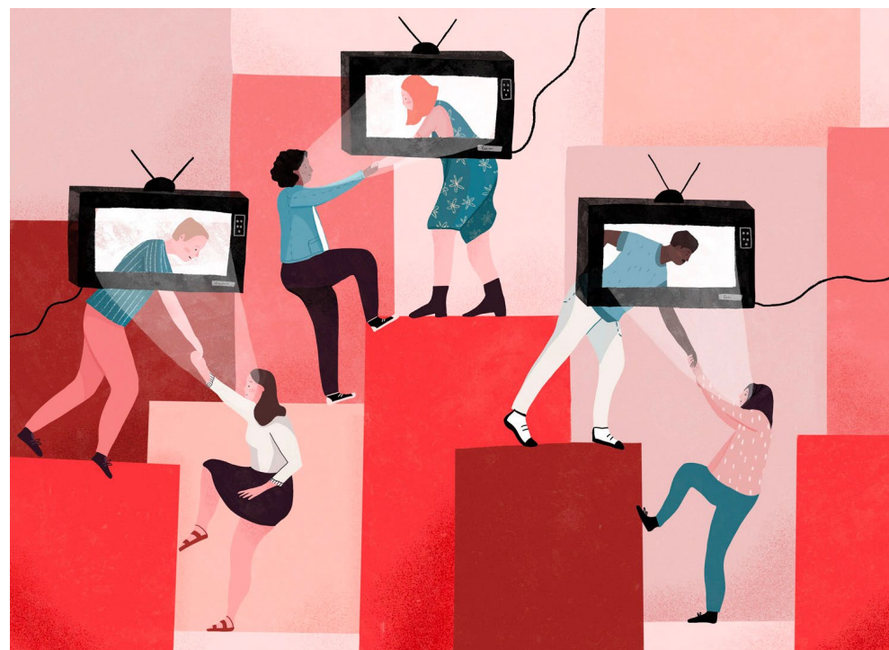
Télévision : quand la bienveillance détrône la concurrence

La revue des médias - Institut national de l'audiovisuel