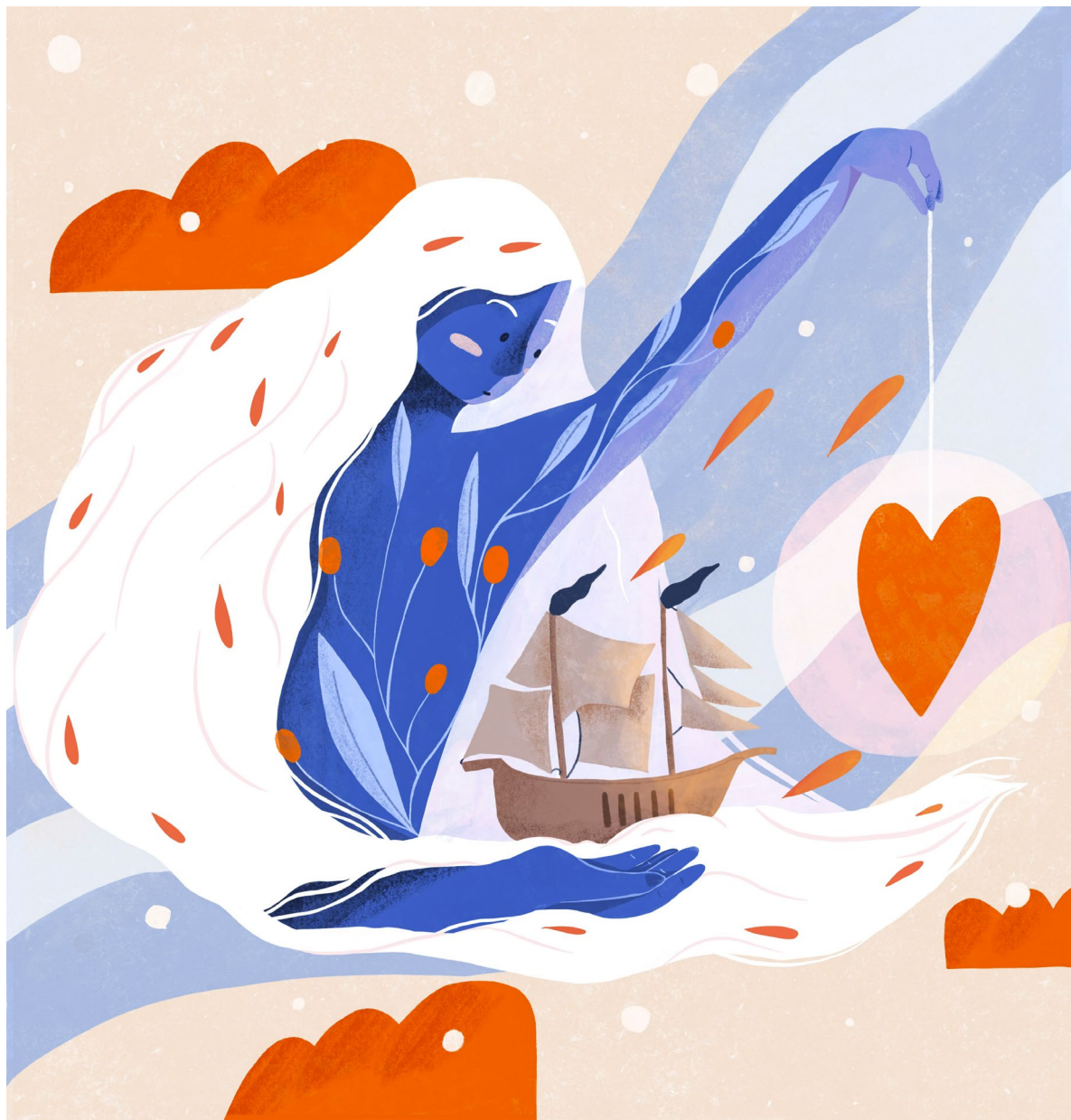
Illustration pour Ester Ramos

Autrice, copywriter pour sa formation "Les voyages d'Ulysse"