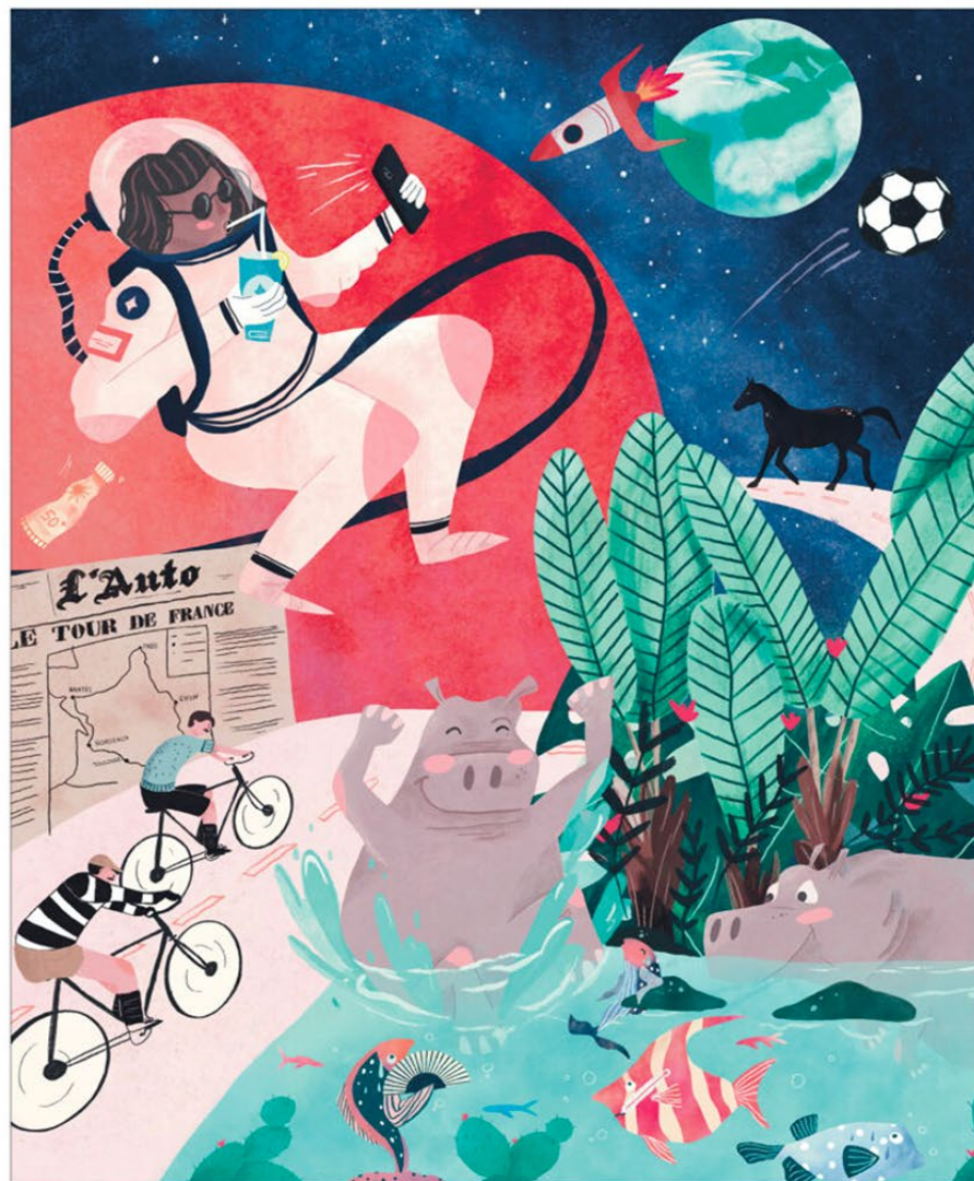
Illustration : Chloé Lelièvre