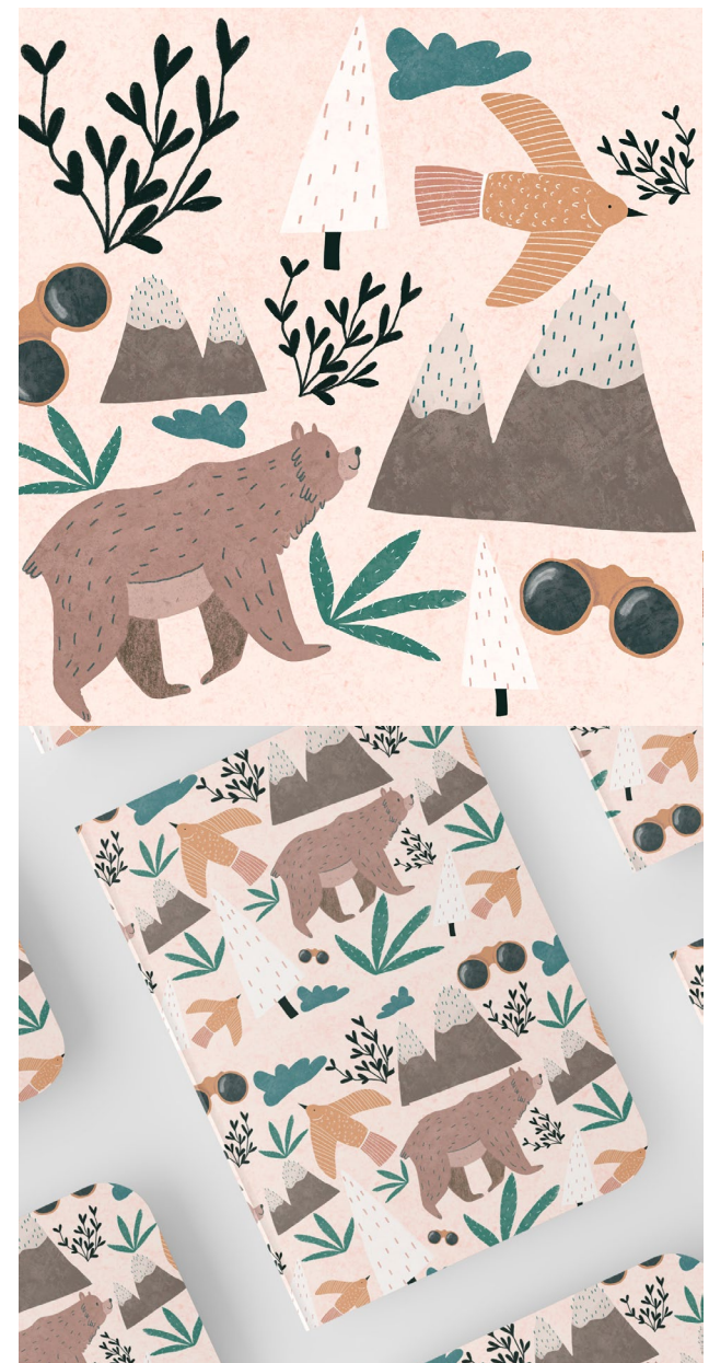
Création de motifs : "Norvège" / "Yosemite" pour collection papeterie