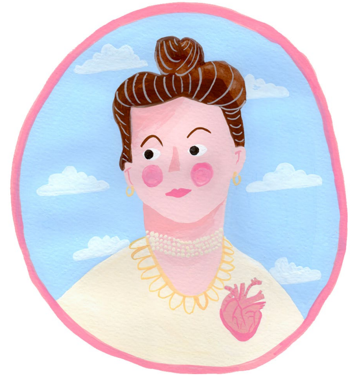
LOUISE DE BETTIGNIES Espionne Française pendant la première guerre mondiale