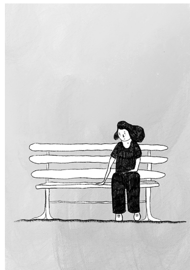
illustration animée sur la thématique du deuil