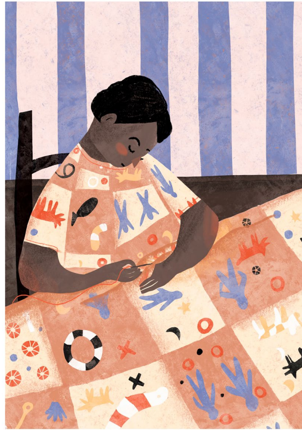
HARRIET POWERS artiste afro-américaine